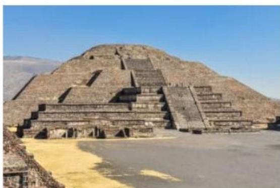
📍 メキシコ/メキシコシティ

メキシコシティは標高が高いところにあり、空気が薄いためか着いた日の夜はよく眠れなかったことが記憶にある。