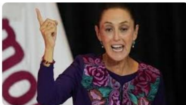
市長時代は治安対策で称賛 メキシコ初女性大統領のシェイン...

今回の選挙の結果は、下院では、与党連合の国家再生運動（MORENA）が243議席、労働党（PT）が48議席、緑の環境党（VERDE）が74議席をそれぞれ獲得し、定数500の下院で与党連合が3分の2を上回る365議席を獲得した。